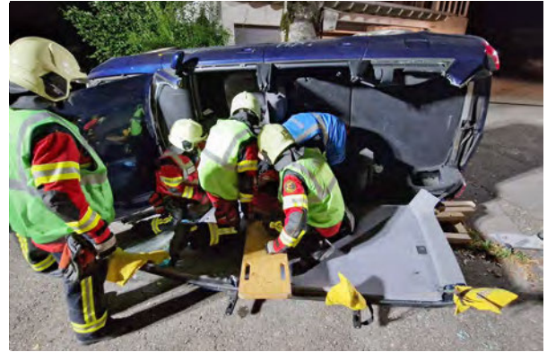
Die Feuerwehr übt eine Strassenrettung.